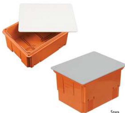
Puszka do złącza odgromowego

Puszka do złącza odgromowego wykonana z materiału PS cechuje się wysoką funkcjonalnością i możliwościami adaptacji do potrzeb użytkownika. Puszka jest przeznaczona do wtykowej zabudowy złącza kontrolnego instalacji odgromowej. Sama puszka zbudowana jest z dwóch zasadniczych elementów, połączonych ze sobą. Konstrukcja puszek umożliwia jej rozsuwanie i zsuwanie, dając w rezultacie płynną regulację wysokości, dzięki czemu można ją dostosować do różnej grubości ścian. Zaletą ta szczególnie przydatna jest w przypadku ścian z dociepleniem. Puszka nadaje się do instalacji w ścianach z dociepleniem o grubości nawet 20 cm. Trzecim elementem składowym puszek jest pokrywa, wykonana z polistyrenu. Zakręcana wkrętami stalowymi pokrywa skutecznie zabezpiecza złącze przed dostępem osób niepowołanych oraz przypadkowym kontaktem ze złączem. Materiał pokrywy jest odporny na promienie UV, dzięki czemu można bez obaw montować ją na nasłonecznionych ścianach. Modułowa konstrukcja puszek umożliwia szybki i łatwy montaż, nawet w nietypowym położeniu. Zamontowana puszka zapewnia bardzo skuteczną ochronę złącza kontrolnego instalacji odgromowej przed działaniem warunków atmosferycznych.